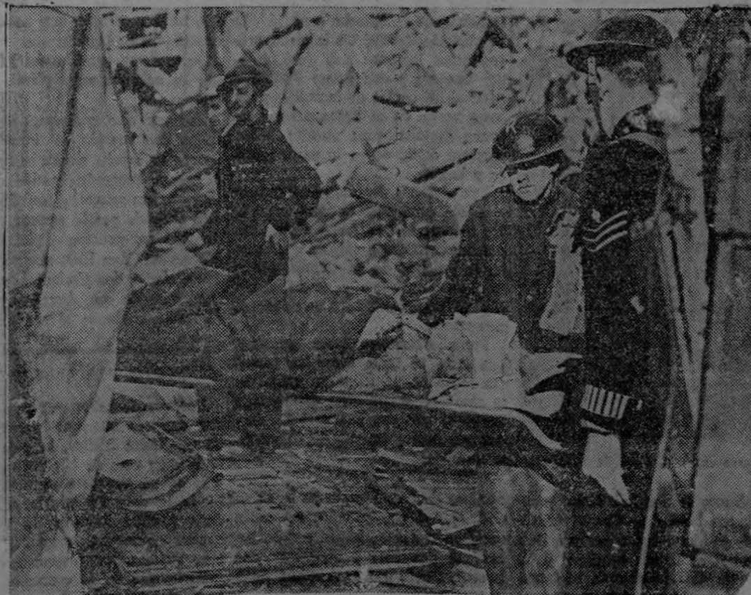
Cuando los aviadores nacis el trabajo de sacar a las víctimas de los escombros. Aquí vemos a una mujer al ser sacada de los escombros de su hogar, bombardeado durante un raid nacist.