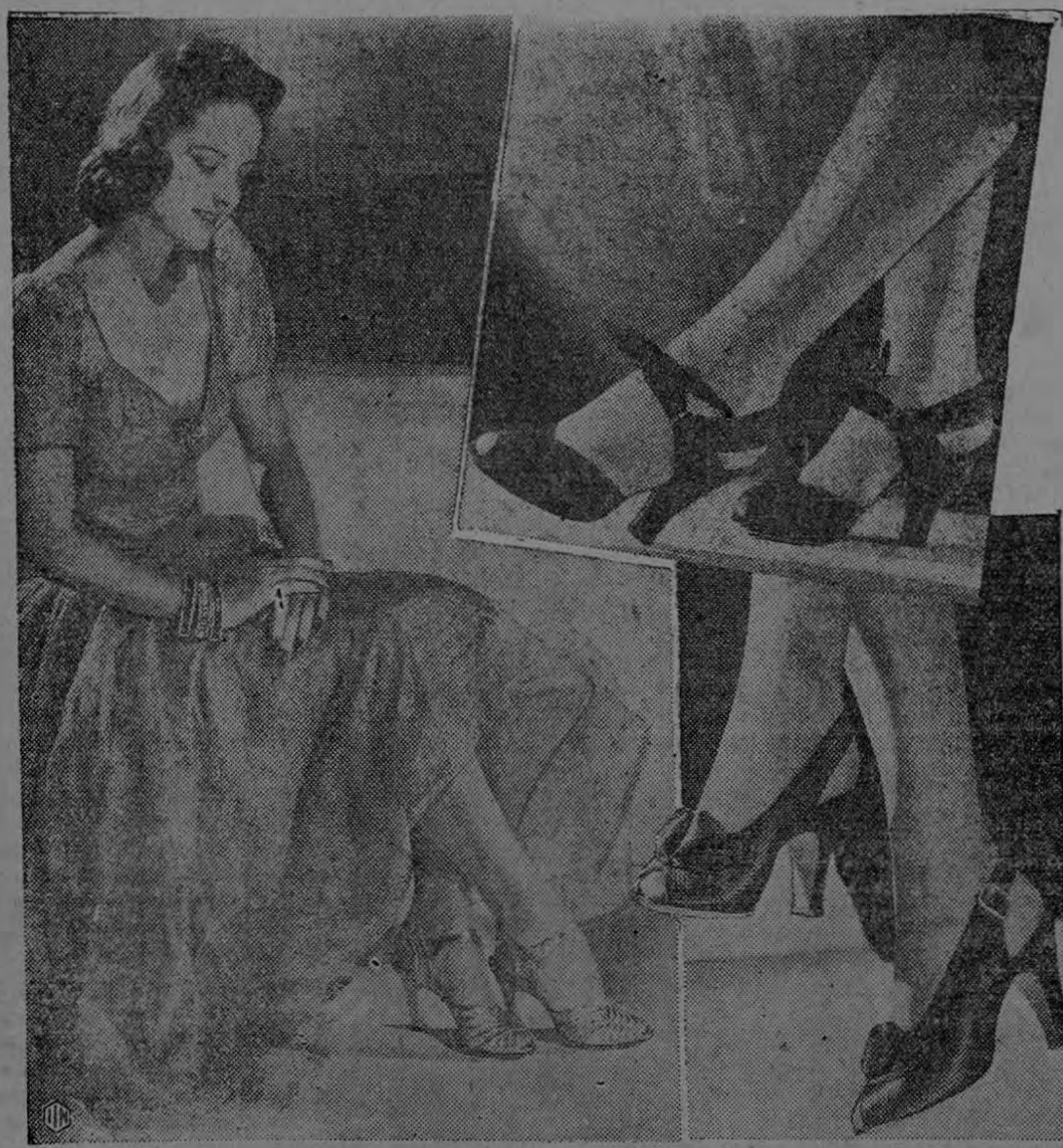
Presentamos aquí tres encantadores modelos de zapatos, que gozan de gran apogeo esta temporada. Son, de izquierda a derecha, una sandalia de oro y plata, una sandalia drapada y una sandalia de satén negro, de punta abierta.