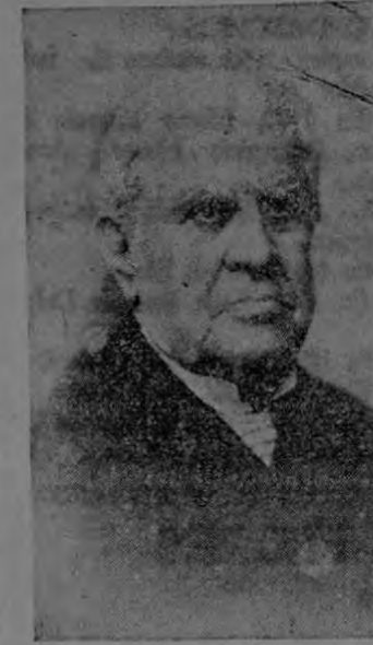
SARMIENTO, el vencedor de la ignorancia

Al acto de inauguración y bautizo del "Paseo Sarmiento" se ha querido dar toda la solemnidad que merece. Y para ello, nada más lógico que contar con el aporte de los estudiantes ya que, como bien sabemos todos, el nombre de Sarmiento brilla con fulgores de gloria en las páginas de la educación y de la enseñanza de América. La Municipalidad de San José y el Instituto Cultural Costarricense Argentino, representados por el Gobernador don