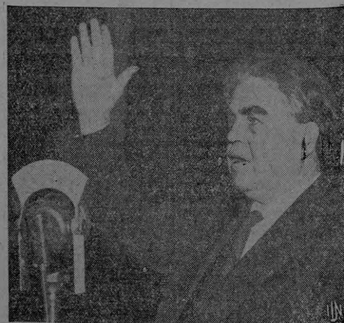
El Presidente del CIO (Comité de Organización Industrial) John L. Lewis al pronunciar un discurso en Washington respaldando la candidatura de Wendell L. Willkie. Manifestó Lewis que renunciaría su presidencia si los trabajadores organizados rehusaban respaldar a Willkie. Su discurso ha sido grandemente respaldado por otros líderes obreros.