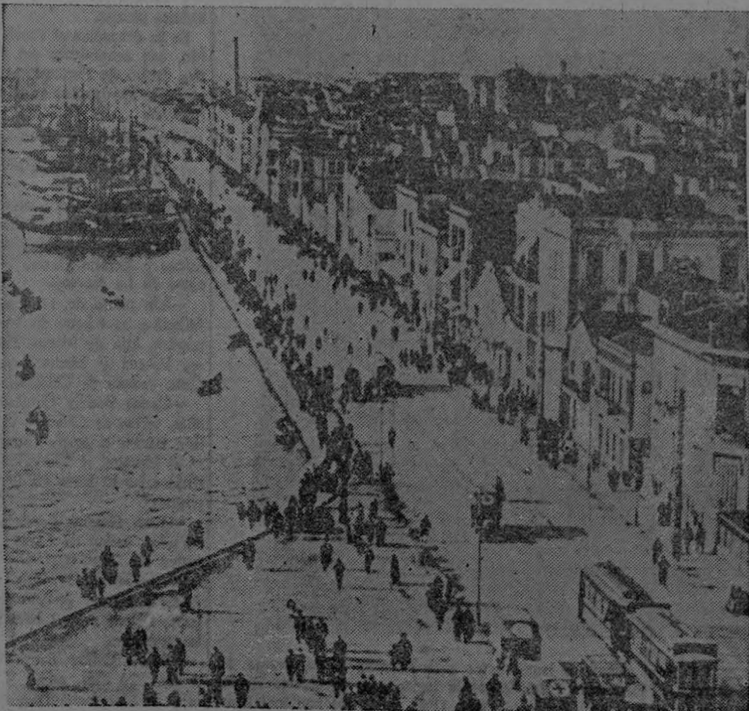
Vista del importante puerto de Grecia, constantemente atacado por los italianos. Como se recordará, este hermoso puerto desempeñó importante papel en la primera conflagración Europea.